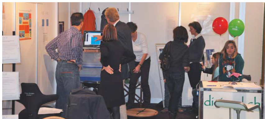
Ein Stand, der bei jungen und alten Besuchern regen Zuspruch fand. | Un stand au succès indiscutable auprès des visiteurs de tous âges. | Uno stand che ha suscitato grande interesse da parte del pubblico.

Il tutto è nato dalla richiesta di un medico che desiderava farci partecipare alla Giornata dedicata alla salute in un liceo di Basilea. Il nostro compito consisteva a testare le capacità d'equilibrio degli allievi. Dato che migliorare la coordinazione sensorio-motrice rappresenta uno dei settori chiave del nostro intervento, abbiamo volentieri accettato questo lavoro. Le prove sono state effettuate con una speciale pedana da noi sviluppata e grazie al programma Sensago sono stati registrati i movimenti e illustrati i risultati sotto forma di grafico. Gli organizzatori della Giornata della salute e gli allievi sono rimasti talmente entusiasti che si è deciso di organizzare una seconda giornata della salute dedicata agli studenti.